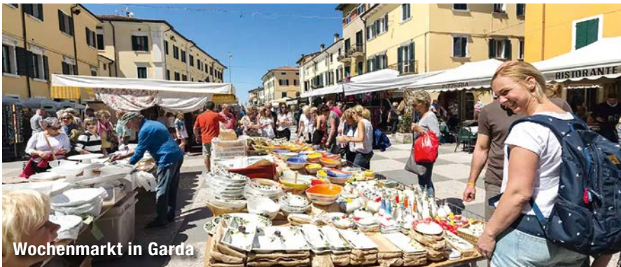
Wochenmarkt in Garda

Bevor wir heute die Heimreise antreten, können wir noch den Wochenmarkt an der Seepromenade, direkt an unserem Hotel besuchen. Dieser Markt zählt zu den größten Märkten der Region und findet jeden Freitagvormittag statt. Anschließend Heimreise.